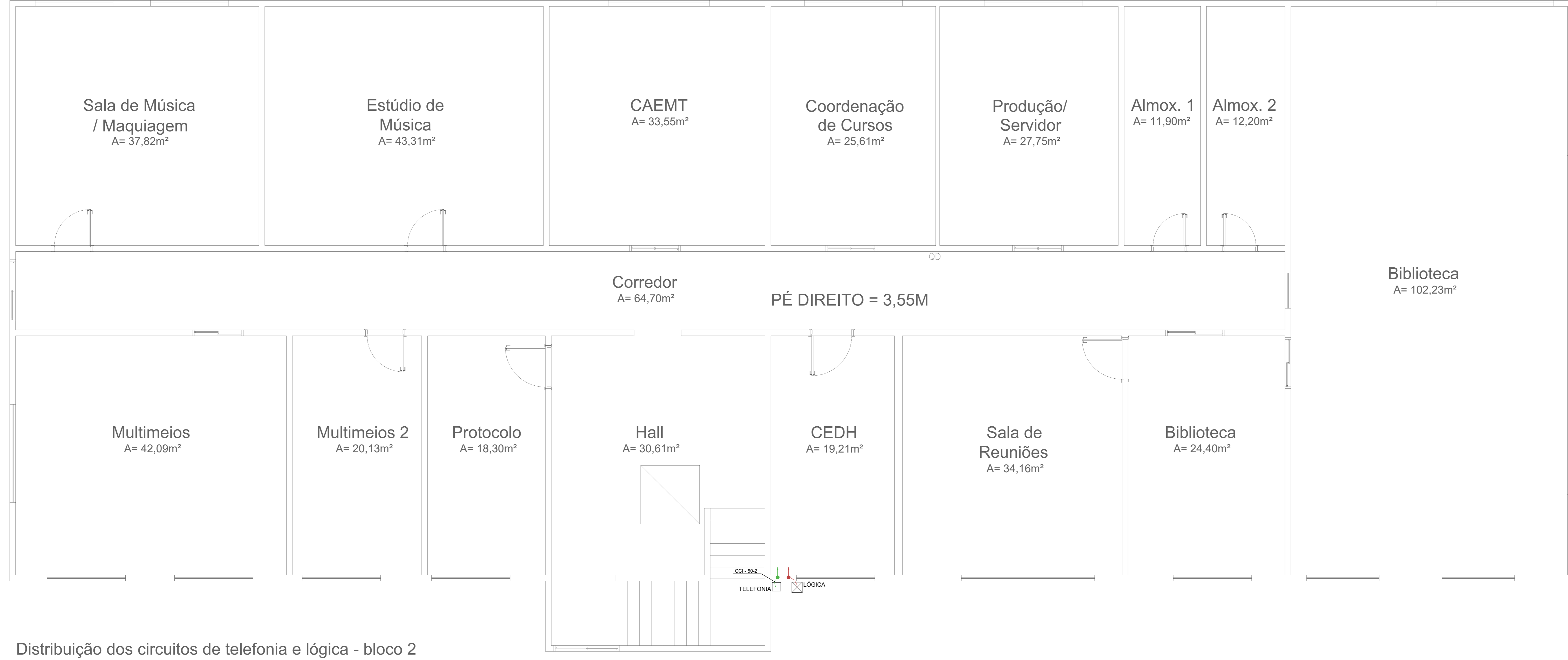
Distribuição dos circuitos de telefonia e lógica - bloco 2 Escala 1:50